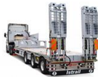
Et produkt fra Istrail